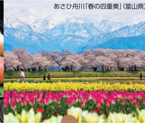
あさひ舟川「春の四重奏」(富山県)