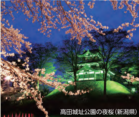
高田城址公園の夜桜(新潟県)