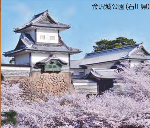
金沢城公園(石川県)