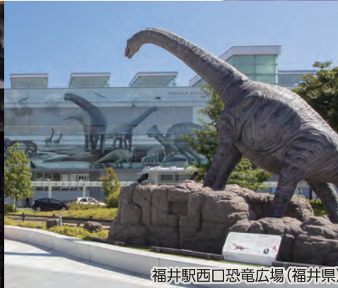
福井駅西口恐竜広場(福井県)